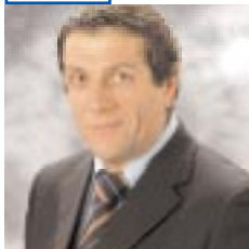
di Ascanio Polimeni